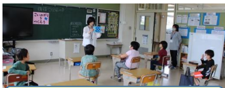
たんぼぼ学級 いろいろな模様のこいのぼりができました！