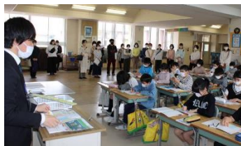
3・4・5年生 さすがです。集中して学習！