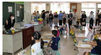
1・2年生 参観日にドキドキ！

保護者の皆様には、学級懇談会（役員決め）、PTA総会とご多用の中、参加していただき、ありがとうございました。また、PTA役員になっていただいた保護者の皆様には、感謝申し上げます。1年間、よろしくお願いいたします。