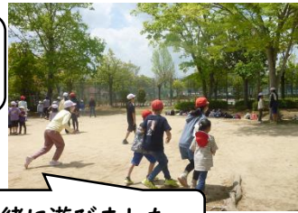
遠足では、一緒に遊びました。