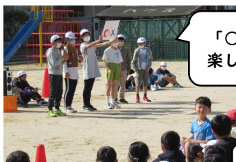
「〇×クイズ」で楽しみました。