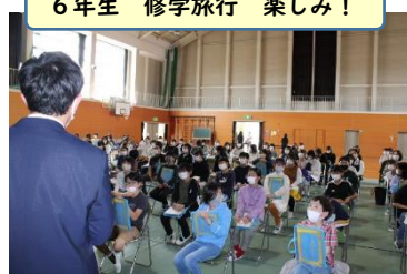
6年生 修学旅行 楽しみ！