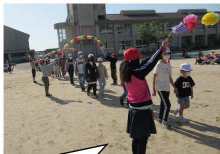
ペアの6年生さんと一緒に！

その後には、1・6年生のペア学年で一緒に、あとは各学年で遠足に行きました。天候にも恵まれ、どの学年も時間いっぱいまで楽しみました。保護者の皆様には、お弁当等でご協力いただき、ありがとうございました。