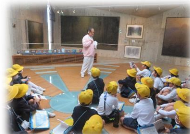
加藤歯科・其阿弥美術館