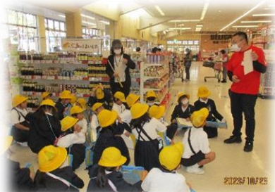
ビックハウス・黒瀬交番