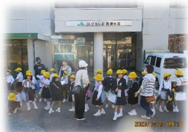
JA・アグリセンター