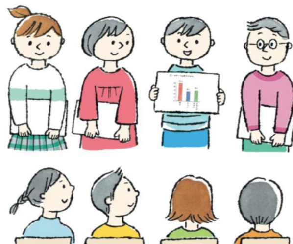
国語科「調べたことを報告しよう」1組