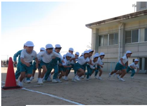
〈3年男子のスタート〉

12月8日（金）の持久走記録会では、子ども達が自分の目標に向かって精一杯走り抜くことができました。応援においでくださりありがとうございました。持久走で身に付けた最後まで粘り強く頑張る力を、これからの学習に生かして行ってほしいと思います。