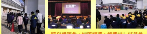
防災講演会・消防訓練・炊き出し試食会