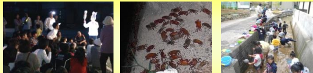
木谷郷川 ぼたる観賞会