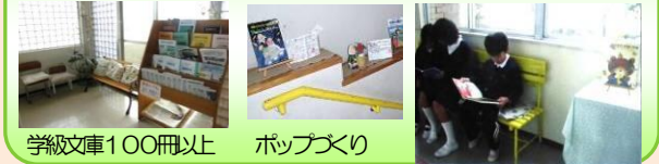
学級文庫100冊以上 ポップズ

いつでも、どこでも読書・読書大好き ～学校まるごとライブラリー～ 学校のいたるところに読書コーナーがあります。