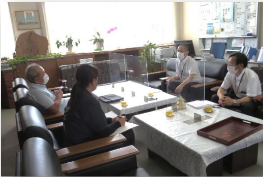
6月28日（火）校長室にて行ったコミュニティースクール連絡会の様子です。

これは地域と学校のパートナーシップに基づく双方向の「連携・協働」へと発展させることを目指しており、子供の成長を軸として、お互いが膝を突き合わせ、意見を出し合い、学び合う中で、地域学校協働活動が、学校にとっても、地域にとっても実りのあるものにしていくための会議です。