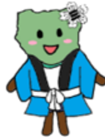
三津小キャラクターの 三津江です。

母校である三津小学校への感謝と恩返し思いから、日々見守り活動を行っています。地域の中で、同じ思いを持つボランティアの皆様とともに、子どもたちの安心・安全を支えています。