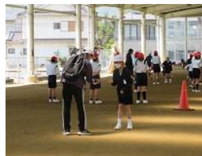
～全校遊び「ピラミッドじゃんけん」～