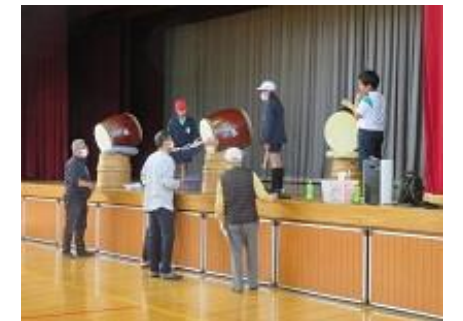
～三津盆踊りの練習の様子～

運動会当日は一人でも多くの方に参観いただけることを子供たちとともに願っています。