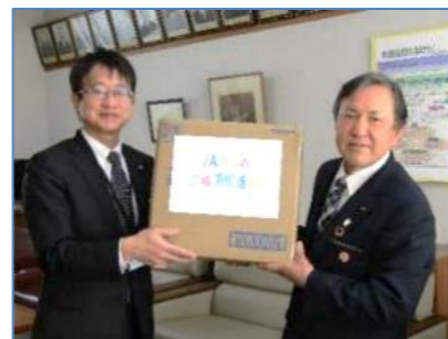
(※撮影時のみ、マスクを外しました)

2月25日(金)、JA共済の地域貢献活動の一環で、本校にマスクを寄付してくださいました。