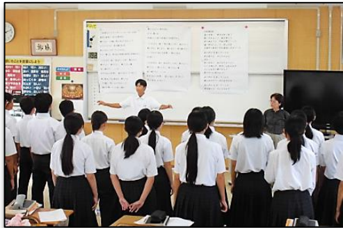
音楽授業（合唱練習）の様子

10月31日（金）の文化祭合唱コンクールに向けて、音楽の授業では合唱練習に熱が入ってきました。練習では、指揮者・伴奏者やパートリーダーが中心となり、クラスを引っ張ってくれています。歌詞や音程が頭に入っていなかったりうまく歌声が出せなかったりと、まだまだ順調とは言えません。しかし、クラスみんなで試行錯誤しながら工夫して練習を重ねていくことで自分たちの合唱もクラスもまとまっています。