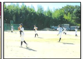
部活動練習の様子