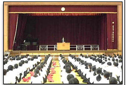
後期始業式の様子

今年度もあっという間に半年が過ぎ、10月となりました。この「チャレンジ向陽！」も第7号を迎えました。昨日16日（木）には後期始業式を行い、今年度後半がスタートしました。前期終業式で学校長から「目標の立て方」についての話がありましたが、生徒の皆さんは秋休みの間に後期の目標を考えましたか・・・？いよいよ3年生は中学校生活、義務教育を締めくくる時期になります。そして、1・2年生も次の学年を目指して個々を、そしてクラス・学年全体を高め、まとめていく時期になります。さあ！後期スタートです！みんなで 新たな目標に向かってチャレンジ しましょう！