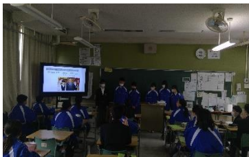
4組 やまだ屋おおのファクトリー