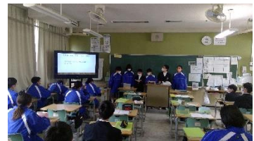
3組 広島電鉄と健康科学館