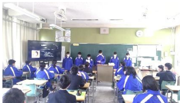
2組 オタフクソース