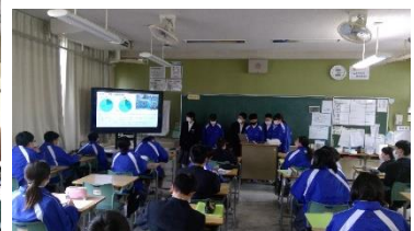
広島県動物愛護センター