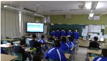
1組 広島県警交通管制センター