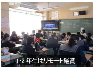
1・2年生はリモート鑑賞

10月31日（土）第38回文化祭を開催しました。コロナ禍で、今年度は文化祭のみの開催となりました。また、体育館のステージ発表は、3年生徒と関係保護者のみの入場とし、1・2年生は、リモートによる学級での鑑賞になりました。保護者の皆様には、来校制限やマスクの着用、消毒にご協力いただき、ありがとうございました。