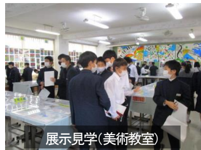
展示見学(美術教室)