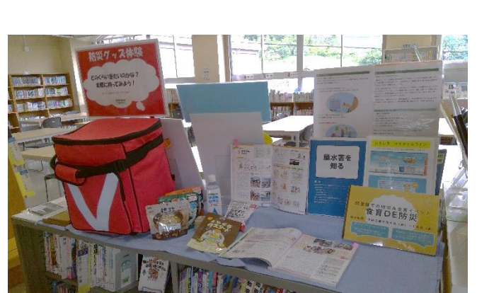
防災グッズや非常食(市内企業で製造)の実物、防災資料の展示。(市教委指導課、危機管理課より)教科書でも関連の単元を確認チェック!