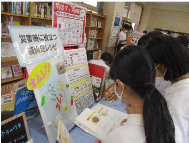
栄養教諭作成のパネル。広島女学院大学人間生活学部管理栄養学科・食育サークルの資料と学生さんからのコメントも掲示しました。生徒のみなさんも興味をもってくれました。