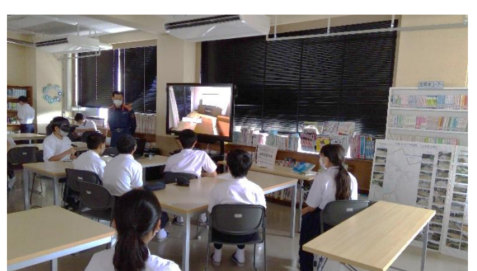
土砂災害避難の2つのポイント「2階以上」「山の斜面と反対側の部屋」に避難することを学びました。