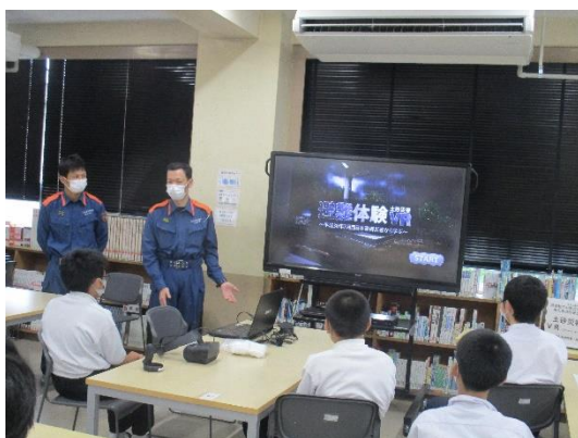
東広島消防署の方をお招きして、出張ミニ体験！1名がVRを装着し、ほかの生徒は電子黒板で見学。