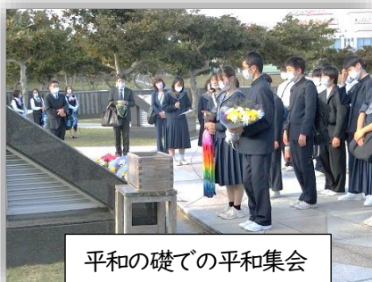
平和の礎での平和集会

沖縄の歴史、そして、自然から生徒たちは様々なことを感じ、学び取りました。また、仲間とともに行動することで、お互いの違いを感じながらも、協働していくことの必要性も感じました。沖縄でしか体験できない貴重な3日間でした。