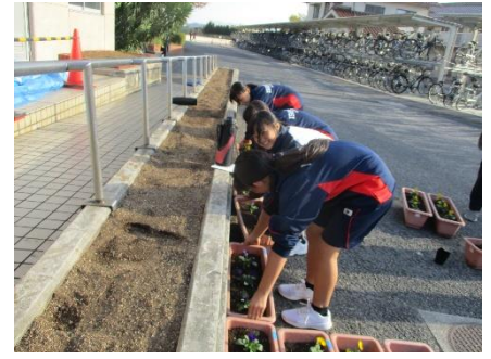
花や苗をつぶさないように