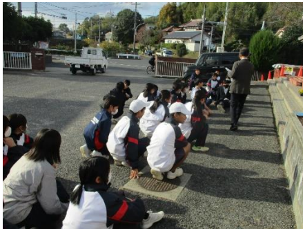
花であふれる町にしたい

今回も地域の方々に花を届けるべく、各部活動で花の苗を植えました。これらを後日、18の事業所に持って行く予定です。地域に愛され、信頼される学校づくり、地域に貢献し、地域を愛する生徒の育成を目指していきます。