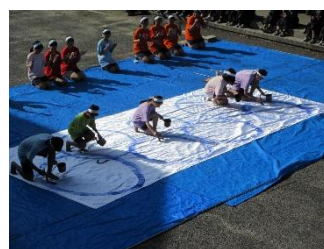
圧巻の書道部パフォーマンス「青春謳歌」