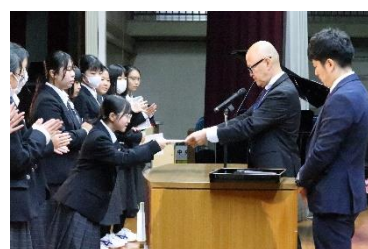
POP コンテスト表彰(国語科)