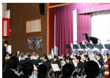
迫力ある吹奏楽部の演奏