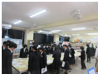
前日は各展示を見て回りました

最優秀賞 3年2組 (学校の代表として11/6(木)の「くらら」での中学校音楽会に出演しました。)