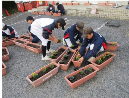
地域の方々に喜ばれたい