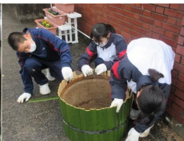
土台をしっかりと固定して