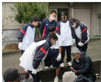
作り方を教えていただきました

また、12月25日(木)には、正力実年会の方々やいつも花の苗を届けてくださる地域の方に御指導いただき、門松をつくりました。竹の切り方、しめ縄の締め方などを教えていただき、日本の和文化を知るいい機会となりました。学校の正門に掲げられた門松は大変立派に仕上がりました。門松づくりに参加した生徒も誇らしげでした。