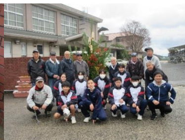
実年会の皆様 ありがとうございました