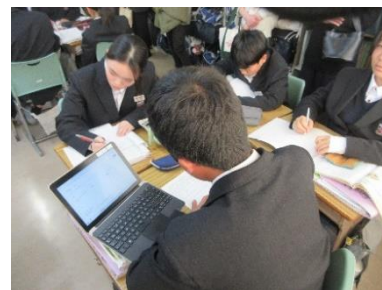
タブレットを効果的に利用