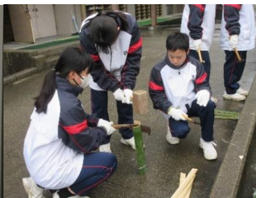
うまく竹を割れるかな？