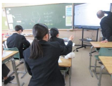
分かるまで取り組む