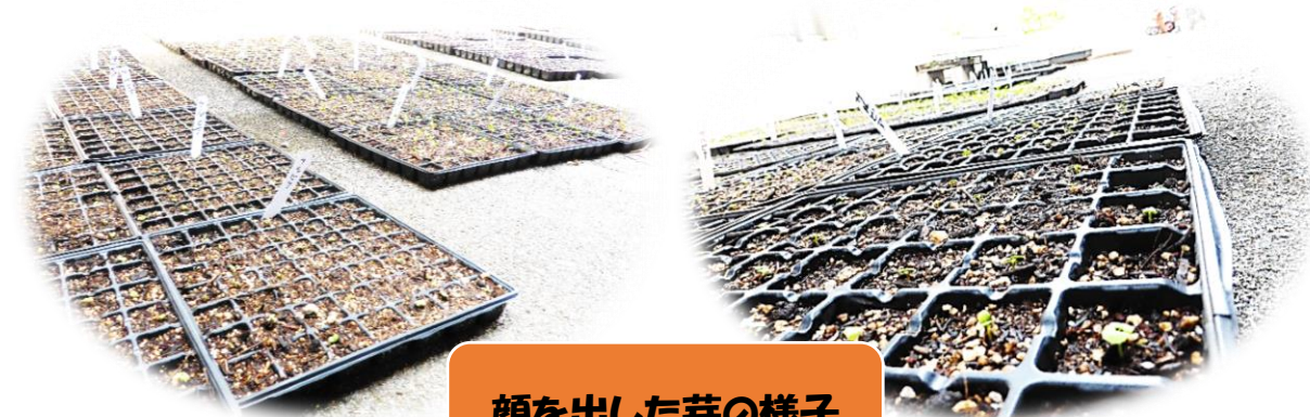
顔を出した芽の様子

5月10日の総合的な学習の時間に各クラス班ごとにマリーゴールド・コリウス・サルビアの種まきを行いました。今では小さな種から、緑の芽が顔を出し始めています。その芽は、太陽の光を浴びてすくすくと育っていきます。もう少しで、花壇やプランターへ植え替えを行います。毎日の水やりや雑草抜きなどの手入れを行い、大きな愛情を受けて育った花でいっぱいの高美が丘中学校に!!