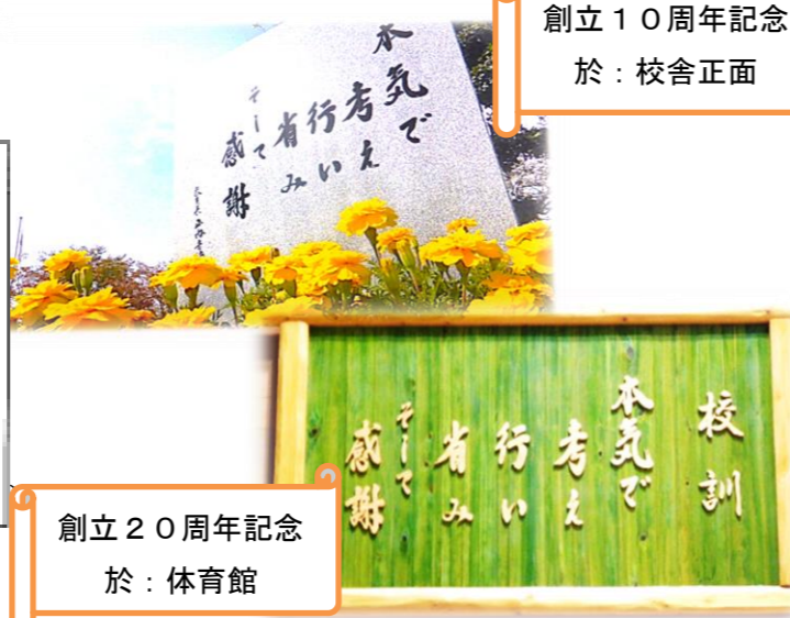
創立10周年記念 於：校舎正面