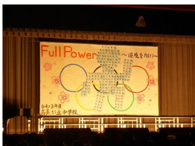
オリンピックをテーマにした 全校生徒モニュメント作品

10月30日（土）、第31回高美が丘中学校文化祭が開催されました。事前の準備が思うように確保できない中で、生徒たちは自分たちで工夫して当日まで全力で取り組みました。『今までの練習の成果を、親の前でしっかり出し切ることができました。どの賞をもらっても最後までやりきった、という気持ちになりました。悔いのない合唱祭となりました。』と、感想を語ってくれました。各家庭2名という制限の中、ありがとうございました。また、コミュニティ・スクール学校運営協議会、高美学区住民自治協議会の皆様にご来校いただきました。重ねて感謝申し上げます。