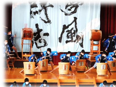
高美が丘小学校 学習発表会