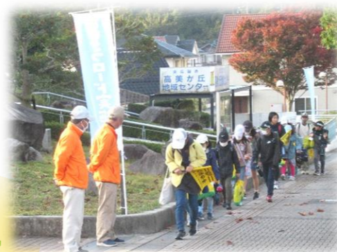
あいさつロード活動