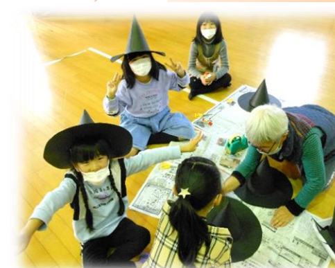
つくしんぼクラブ(放課後子ども教室)