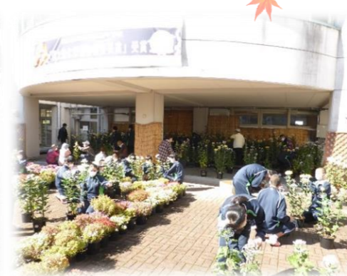
高美が丘中学校 菊づくり講座