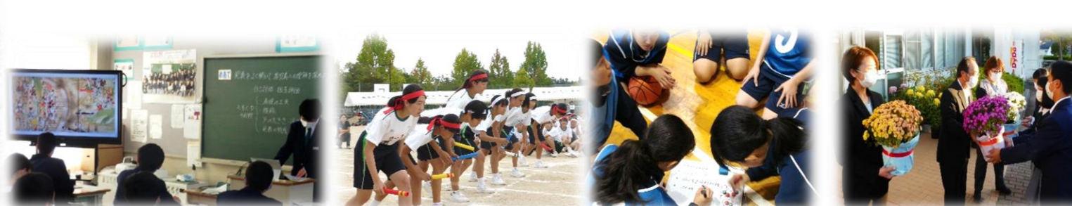
〈高美が丘中学校 教育活動の様子〉

高美が丘中学校は、昨年度に第34回毎日カップ「中学校体力づくり」コンテスト(応募総数2,322校)で全国1位相当の文部科学大臣賞を受賞し、今年度はデジタル化社会の形成者を育成するためにタブレットを活用した授業研究にも取り組む等、生きる上での基盤となる心身を鍛えながら、新たな知の習得・活用を目指しています。また、平成25年度から始まった「菊づくり」は、花にあふれた学校づくりを行うことで生徒たちの生命尊重の心を育てるとともに、持続可能な社会の担い手を育成しています。緑化活動は、PTAや地域の方々にも協力していただいております。花々によって学校と地域、そして地域の人と人がつながっています。