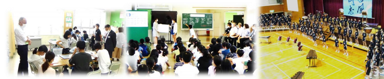
〈高美が丘小学校 「高美が丘プロジェクト」の様子〉

平成28年度からは、「高美が丘の町を愛し、よりよい町にしていこうと地域に積極的に働きかける子どもの育成」や、国語や算数などの教科の学びと関連させることで、「課題発見力」、「振り返り力」、「かかわり合い協働する力」の育成を目的に、総合的な学習の時間で「高美が丘プロジェクト」が始まりました。「高美が丘プロジェクト」で、6年間を通して児童たちは地域の方々の助言を得ながら学びを深化させ、地域に住む一人として地域のまちづくりに貢献していきます。