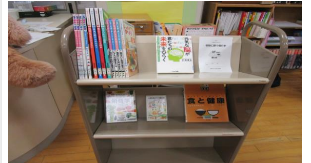
本の展示と、ブックリスト。