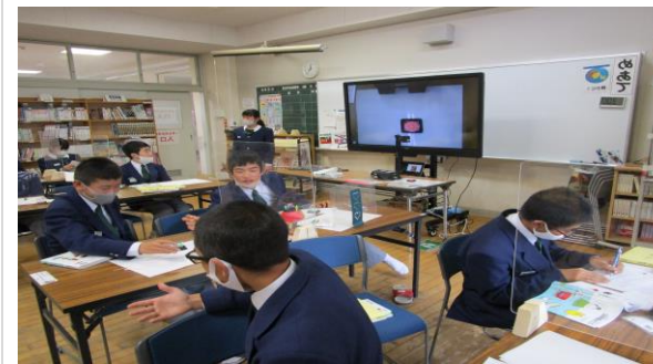
付けた名前と、名前に込めた思いを発表しました。