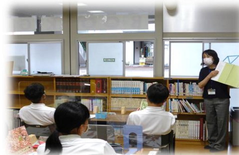
参考文献の書き方の説明を聞きました。