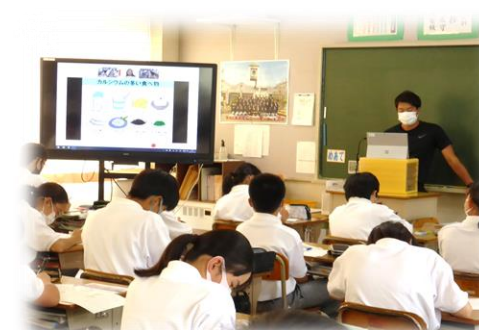
オンライン授業の様子。

○1年生～3年生 保健体育 食育セミナーオンライン授業「成長期の運動と食事」 図書館では「運動と食事」に関するブックリストを作り配布しました。