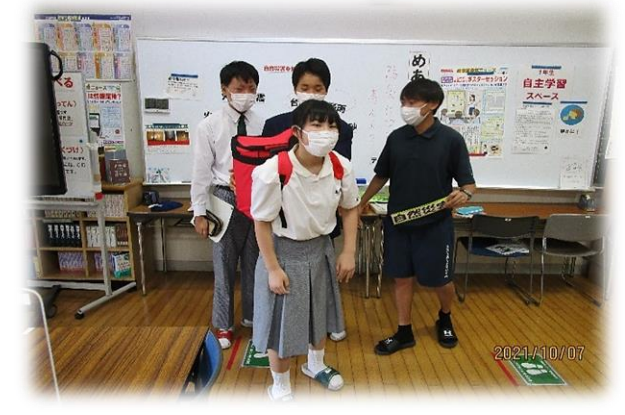
「学ぼう！命を守る行動」の授業の様子