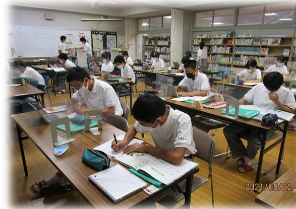
環境問題調べの様子

図書資料、タブレットを使用して「環境問題」について調べ、レポートにまとめました。