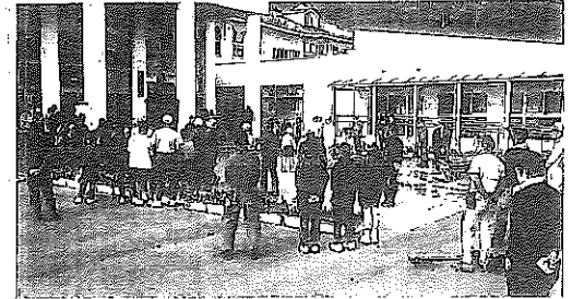
保護者 vs. 中学生教職員の勇姿!!