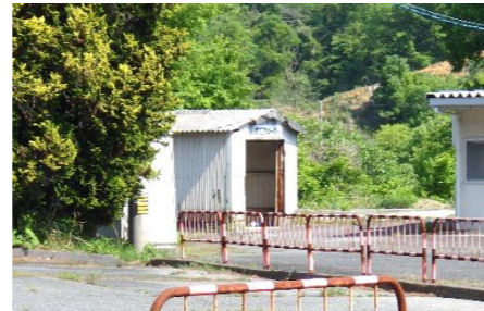
【スクールバス駐車場の奥 資源回収コーナー】

【回収物】アルミ缶、段ボール、雑誌、牛乳パック、新聞紙(チラシは別綴じでお願いします。)