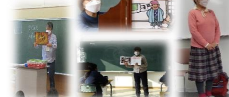
〔読み語りボランティア〕