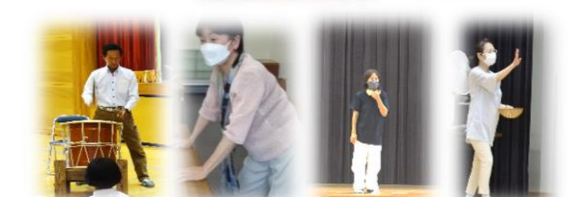
〔和文化ゲストティーチャー〕