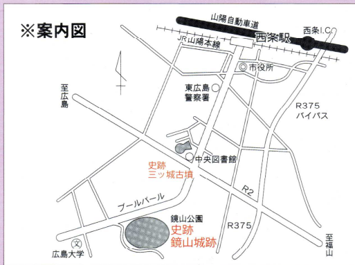
史跡鏡山城跡の位置図

大内氏は、朝鮮や明との通交につとめ、学術工芸を奨励し、キリスト教の布教を許すなど、独特の山口文化を育みました。天文20（1551）年、重臣陶隆房（晴賢）は謀叛を起こして義隆を討ち、その甥義長を擁立しましたが、天文24（1555）年、毛利元就と厳島に戦って敗死し、大内氏は弘治3（1557）年滅亡しました。