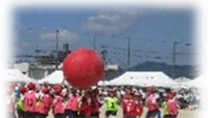
4年生「大玉運び～心をひとつに～」