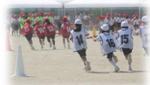
3年生「きらめけ！チームタイフーン」