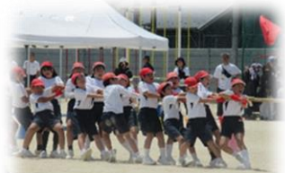
5年生「綱引き～一致団結～」