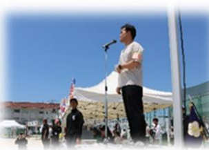
PTA 会長 挨拶