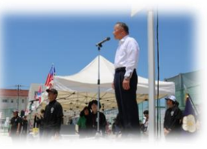
学校運営協議会会長 万歳三唱