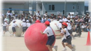
2年生「おたから大玉ころがし」