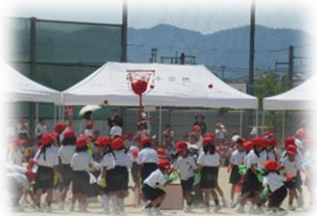
1年生「なかよし玉入れ」