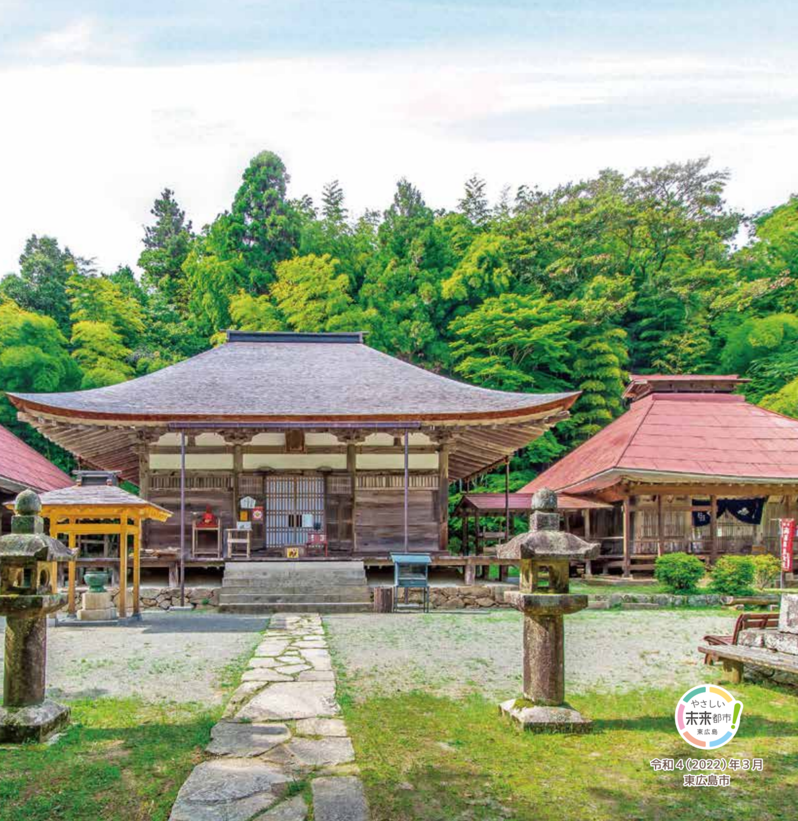
表紙 / 竹林寺 令和4(2022)年3月 東広島市