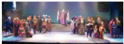
市民ミュージカル

せせらぎホールを文化活動の拠点として地域文化の向上及び児童の情操教育づくり等を推進します。その1つとして市民ミュージカルの開催を支援しています。