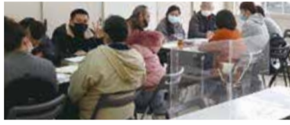
交流型教室「にほんこわいわい」

外国人市民の地域活動への参加を促進するため、関係団体と連携し様々な交流事業を行います。