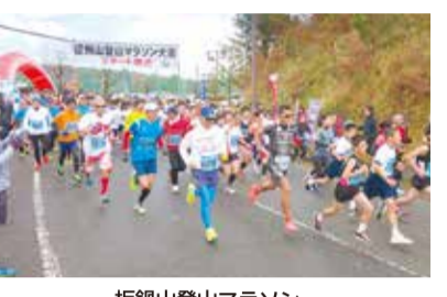
板鶴山登山マラソン

ディスカバー東広島等と連携し、観光拠点の発掘と磨き上げを行い、観光振興を図ります。また、ごまんなか豊栄へつまつりをはじめ、板鶴山、天神嶽、オオサンショウウオなどの自然や地域資源を活かしたイベントや交流事業を推進します。