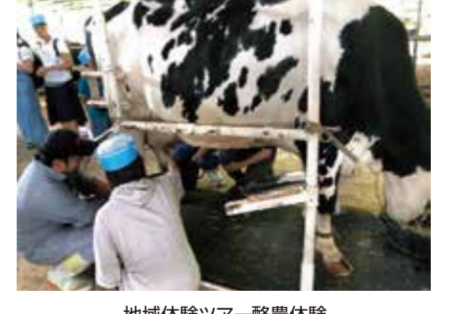
地域体験ツアー-酪農体験

市内にキャンパスを持つ大学と連携し、大学・学生と地域との交流・連携を促進するとともに、地域体験ツアー「[ひがしひろしま学生×地域塾]」を開催するほか、学生と地域とのコーディネートを行います。