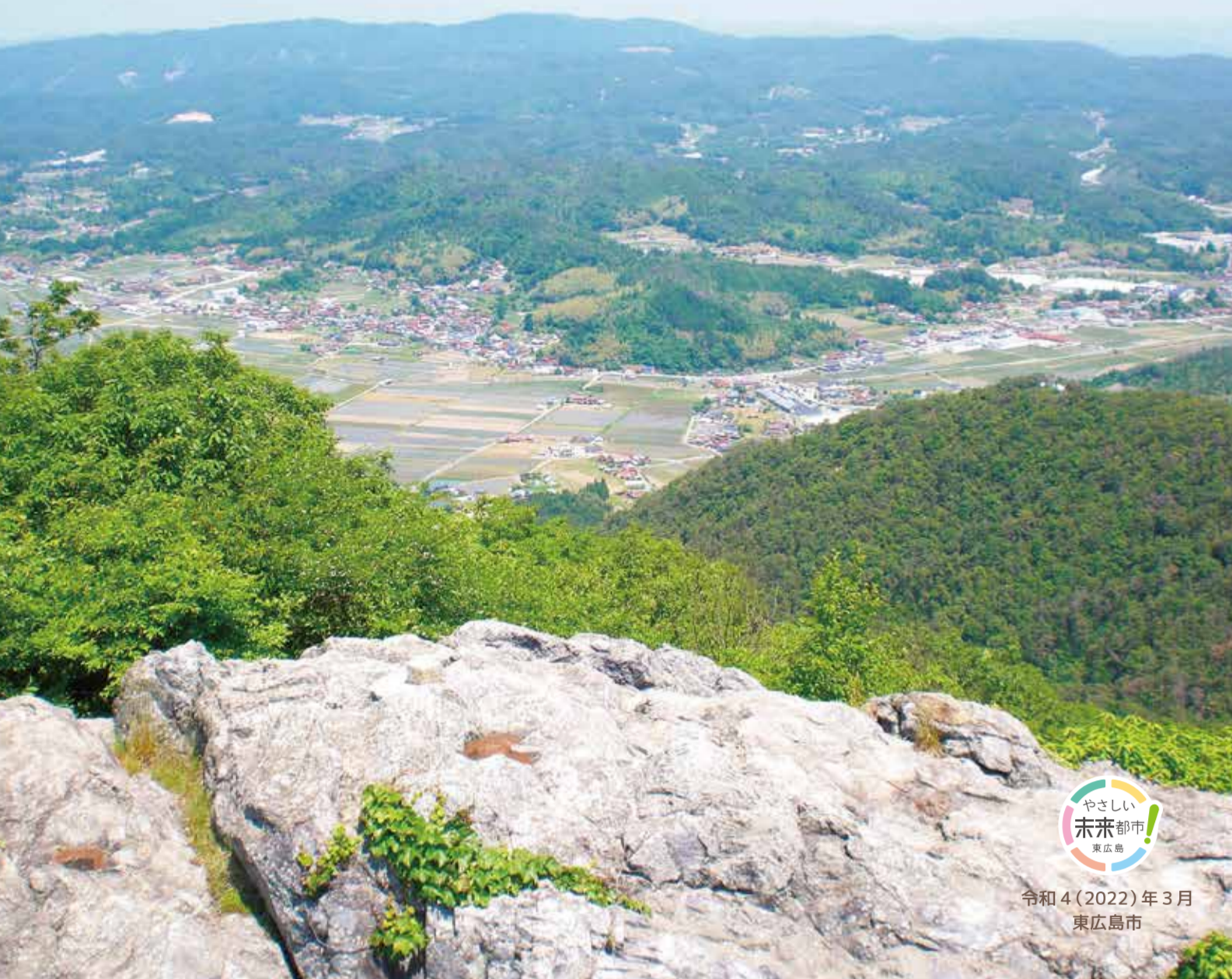
やさしい 未来都市 東広島 令和4(2022)年3月 東広島市