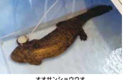
オオサンショウウオ

全国的にも貴重なオオサンショウウオの繁殖地として知られており、緊急保護施設によって保護を進めるとともに、フィールドワークや地域学習、図書等資料の収集展示によって活用を図ります。