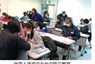
外国人市民のための防災教室

オンラインを活用した相談対応や日本語学習支援のほか、関係団体と連携し様々な交流事業を行います。