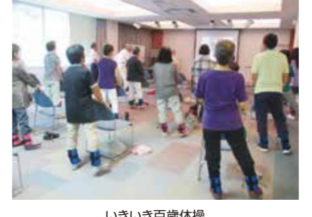
いきいき百歳体操