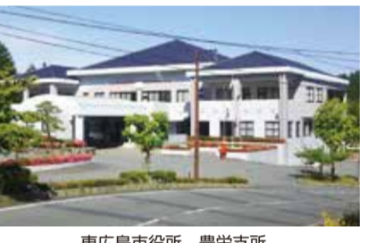
東広島市役所 豊栄支所

支所庁舎の改修において、交流拠点等となる多目的ロビーをレイアウトし、施設の有効活用を図るとともに、広島大学総合博物館との連携や支所庁舎の一部を消防団の待機室として整備するなど、公共施設の複合化を実施します。