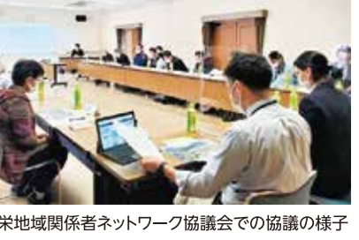
豊栄地域関係者ネットワーク協議会での協議の様子

年代や属性に関わらない共生型の居場所づくりや住民主体の互助活動を支援するため、エリア担当コミュニティソーシャルワーカーを配置し、空き家対策と地域活動づくりなど、地域住民と協働を図ります。