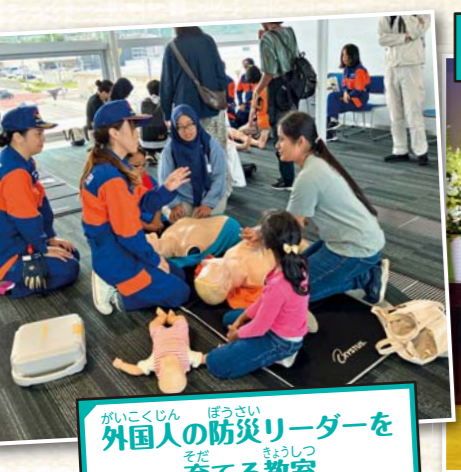
がいこくじん ぼうさい 外国人の防災リーダーを 育てる教室