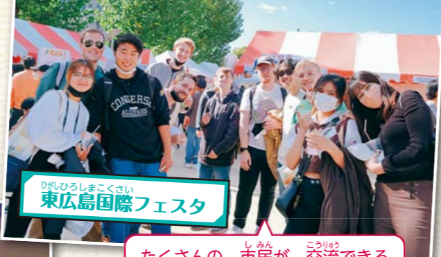
ひがしひろしまこくさい 東広島国際フェスタ

がいこくじん しんみん に ほんご 外国人市民が 日本語で スピー チを します。日本の文化 日 本の生活で 感じたことなど について 話します。