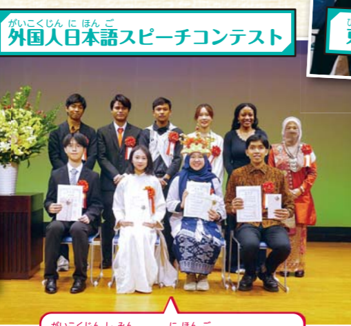
がいこくじん に ほんご 外国人日本語スピーチコンテスト

がいこくじん しんみん に ほんご 外国人市民が 日本語で スピー チを します。日本の文化 日 本の生活で 感じたことなど について 話します。