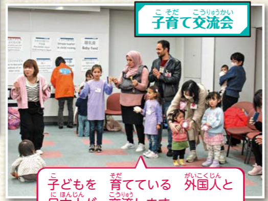
こそだ こくりゅうかい 子育て交流会