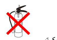
جهاز إطفاء الحرائق