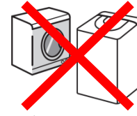
غسالة الملابس. مجفف الملابس