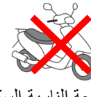
الدراجة النارية. السكوتر