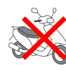
オートバイ・原付バイク