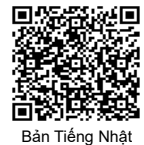
Bản Tiếng Nhật

✦ Khi trẻ nhỏ có triệu chứng bất thường về sức khỏe, nếu bạn không biết nên làm thế nào, có nên đi bệnh viện hay không thì hãy gọi đến số: #8000 (trường hợp không kết nối được thì gọi đến số 082-505-1399) để nhận được sự tư vấn. Thời gian hỗ trợ: mỗi ngày, từ 19 giờ tối đến 8 giờ sáng ngày hôm sau.