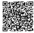
Bản Tiếng Anh