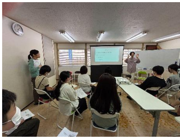
あいびいでの高校生との交流の様子