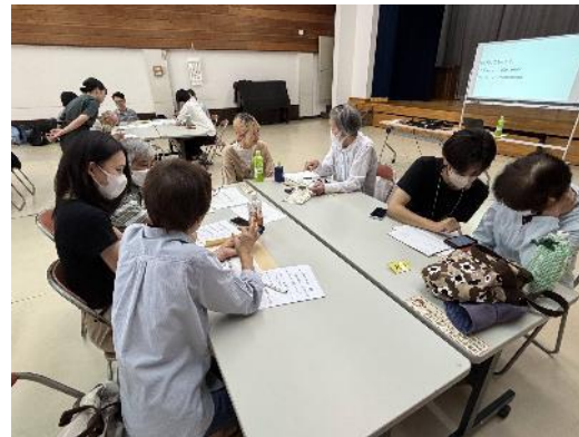
スマホ講座を行っている様子