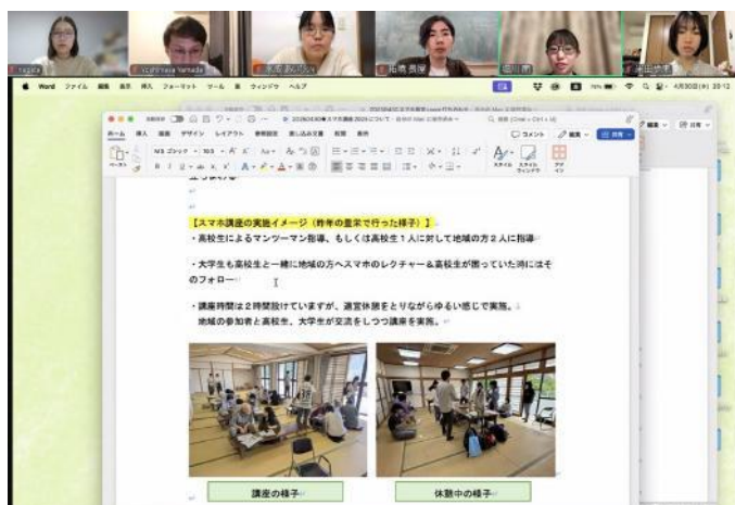
オンラインでの打ち合わせの様子

スマホ講座実施のために、大学生とコーディネーター、あいびいの職員がオンラインで顔合わせと打ち合わせを実施した。スマホ講座の内容や講座の日時、事前の準備等の検討事項について話し合いを実施し、講座の内容や当日までの動きについて確認、決定した。基本的には、高校生が講師としてスマホ講座を実施し、大学生が高校生のフォローを行うことになった。