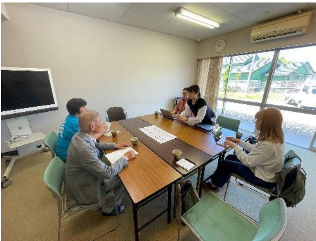
地域の方と打ち合わせする様子

高屋西地域センターを訪問し、地域センターの方々とスマホ講座に向けた打ち合わせを実施した。スマホ講座に向けて、講座の内容を説明し、参加する学生の数の確認、準備物や金銭面の確認をとった。会場の下見も行い、当日に向けた準備・動きを把握した。