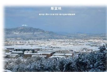
西条町下見に隣接する東部方面 セツ池を水源とする120ha余の田園が広がる穀倉地域 小倉神社と広島大学付近から撮影