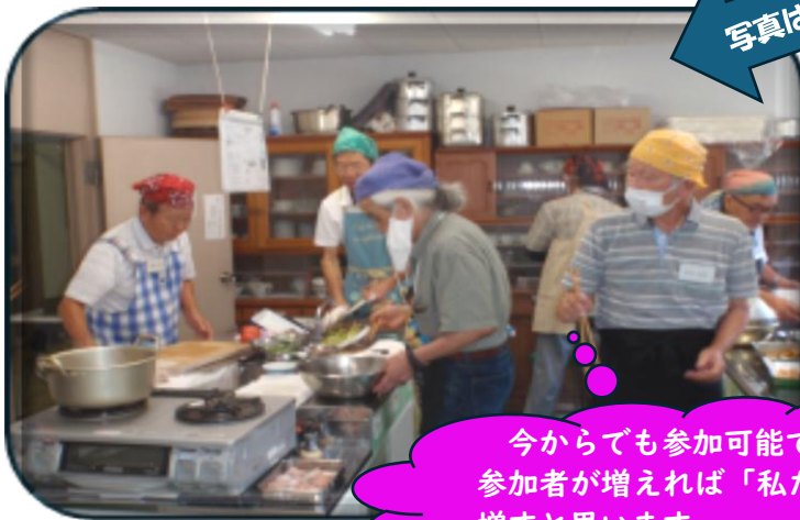
写真は昨年度のものです