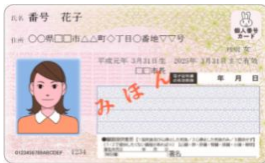
マイナンバーカード(見本)