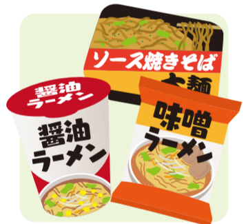
インスタント食品