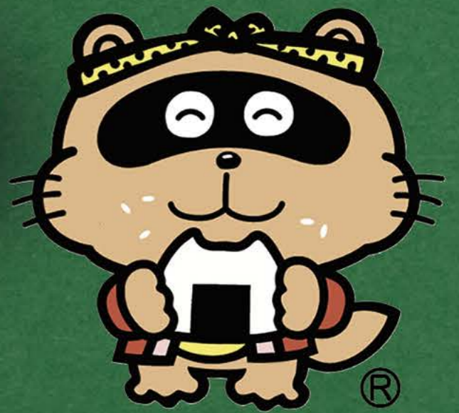
東広島市観光マスコット「のん太」