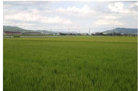
広がりのある農地