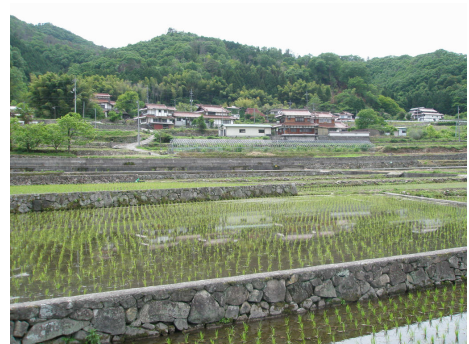
農地と赤瓦の集落