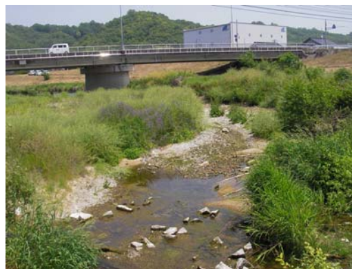
渇水のため流れが途切れた河川 (平成 25 年、広島県内)