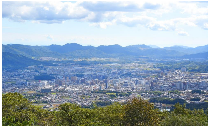
写真：龍王山山頂からの眺め（西条町）