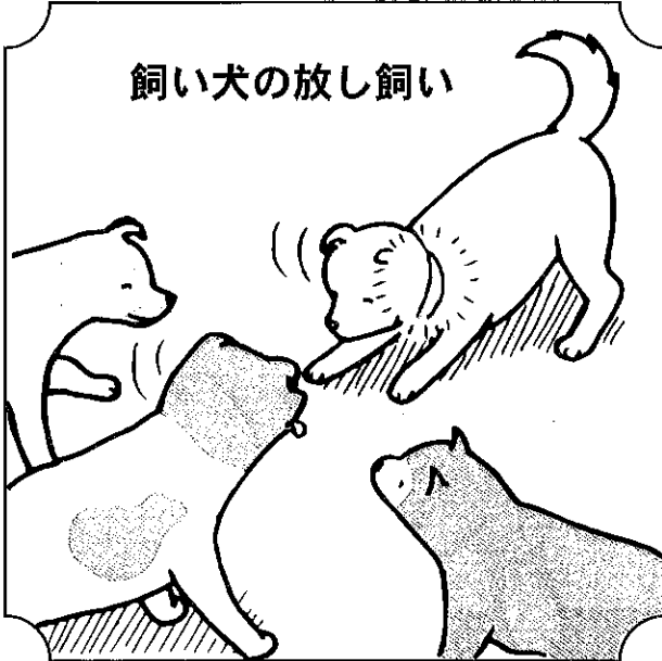
飼い犬の放し飼い