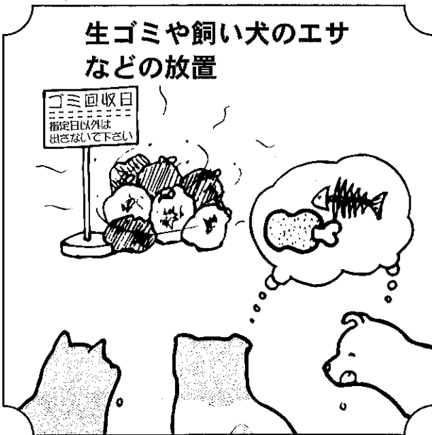
生ゴミや飼い犬のエサ などの放置