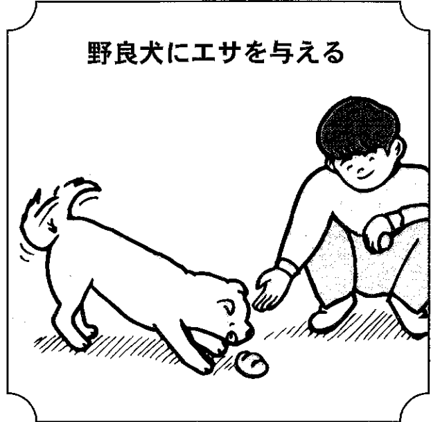
野良犬にエサを与える