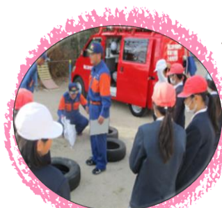
土嚢づくり／ 消防団等