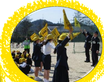
交通安全教室補助 ／PTA・地域住民等