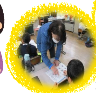
放課後学習支援 ／ボランティア