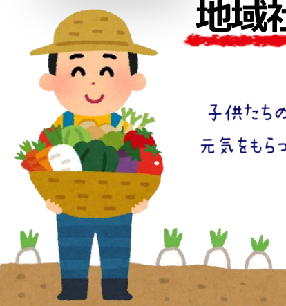
子供たちの姿に 元気をもらっています