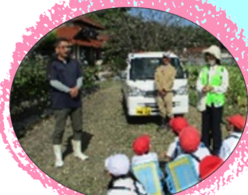
地域農家の見学／ 地域住民等