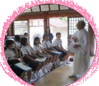
地域課題を解決し地域に 貢献する探究的な学び ／地域センター・喜楽会等