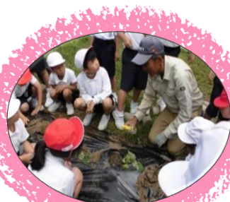
野菜作り等の栽培活動 ／地域住民等