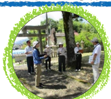
教職員による地域探求 ／地域センター・喜楽会等