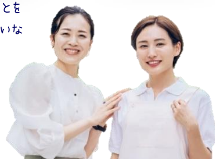
子供といっしょに 参加して地域の人との かかわりが増えました