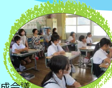
防災教育 ／青少年育成会議