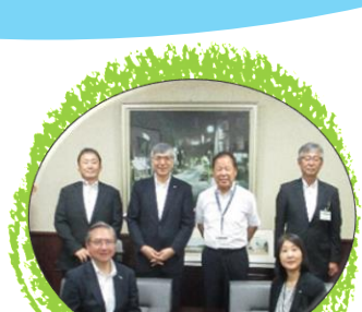
地域との連携・ボッチャ体験 ／広島国際大学