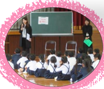
話し方教室／ 地域センター