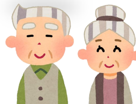
学校に行くように なって仲間が 増えました