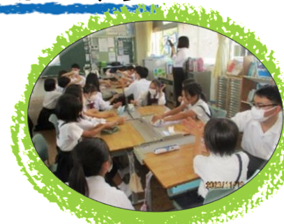
福祉についての学習・手話／ 黒瀬高等学校