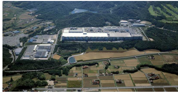
吉川第二工業団地完成イメージパース