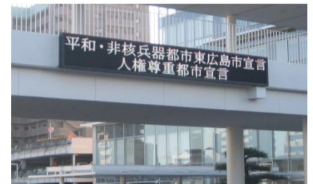
都市宣言デジタル表示盤