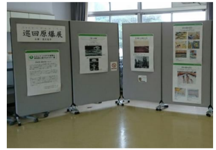
学校での巡回原爆展