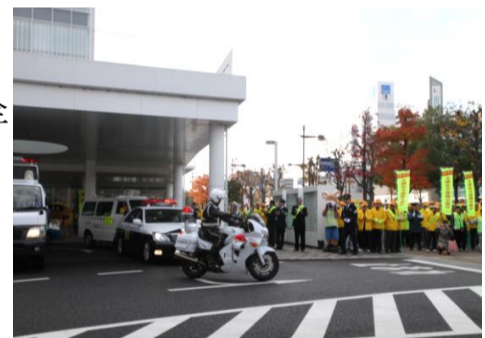
交通安全運動出発式(H28年:年末)